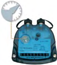
Универсальный сумматор оснащенный меткой для установки датчика Cyble

Кроме датчика, который формирует на выходе низкочастотный импульсный сигнал есть варианты исполнения с возможностью передачи информации по шине *M-Bus или радиоканалу (не взрывозащищенные исполнения). Также есть исполнение датчика с дополнительным выходом для контроля целостности кабеля и компенсации обратного потока.