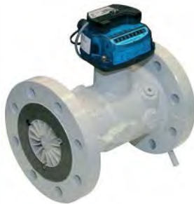
Счетчик TZ/Fluxi с универсальным

*шина M-Bus – (Metering Bus), Европейский стандарт EN1434-3, шина передачи данных применяемая в стационарных сетях для дистанционного снятия показаний со счетчиков по проводным линиям связи.