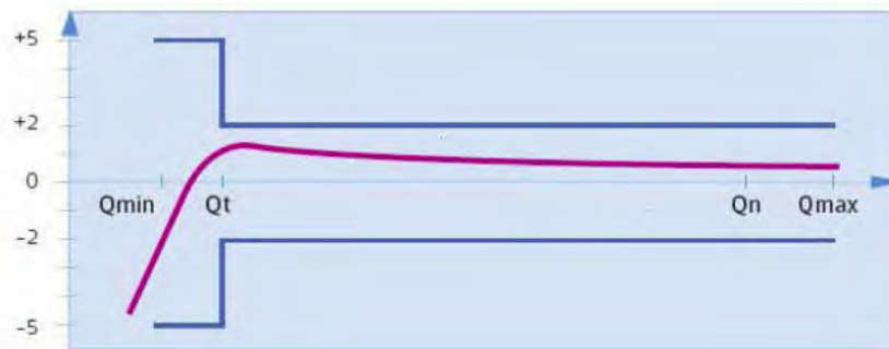
(График) Стандартная кривая точности измерений, модель Flodis DN15