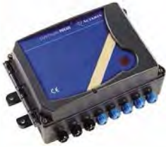
Преимущества модема FOCUS: